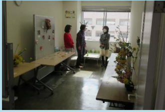
生花・水引作品展示 (グループリコさん)