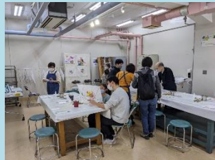
友禅染め体験 (花友禅さん)