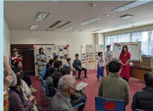
世界のことばと遊びの広場 (NPO 法人多言語広場セルラスさん)