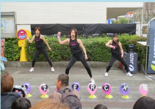
☆今年の注目は、サークル常連ながらてくの まつりは初参加の「ジャザサイズ」さん。 寒空の中、圧巻のパフォーマンスで観る 人を魅了してくれました。