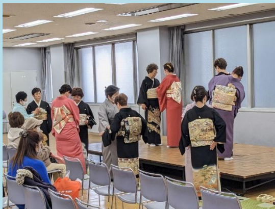
きもの着付実演・解説 (川崎着付士協会さん)