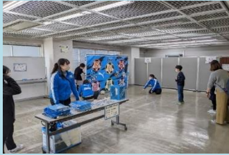
キックターゲット (川崎フロンターレさん)