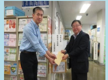
☆チャリティ販売の売上 37,100 円は能登 北分会さん) 半島地震で被災された方を支援するた め、高津区社会福祉協議会に義援金と して寄付されました。