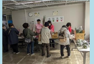
花桃・産直野菜チャリティ販売