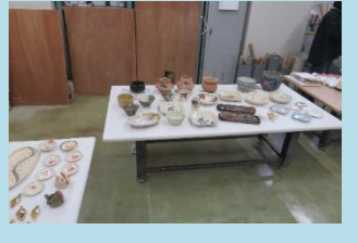
陶芸作品展示・販売 (金曜陶の会さん)