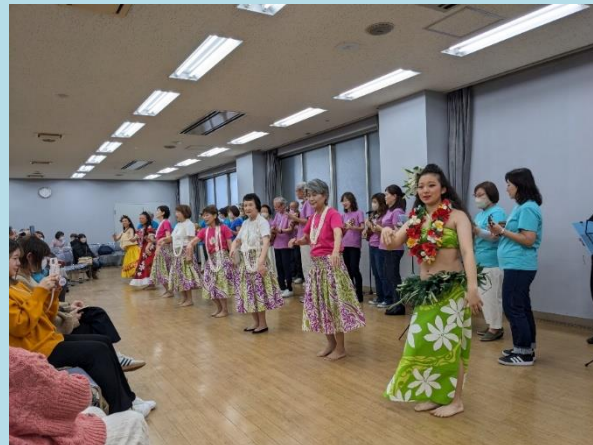
ウクレレ・フラダンスショー (Halau O Pua' Olenaさん)