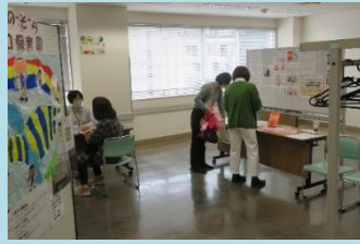
整体カウンセリング (にっこり自力整体さん) 保育相談・子育て支援 (にじのそら溝の口保育園さん)