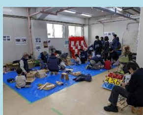
アイス作り・輪ゴム鉄砲 (建設ユニオン神奈川支部川崎地区