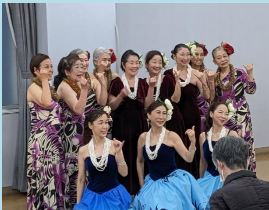
フラダンスショー (Hoaloohaさん)