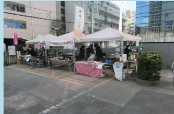
骨付きフランク (川崎市食肉商業協同組合さん) 溝ノロカレー・ドリンク (株式会社 Checkmate さん)