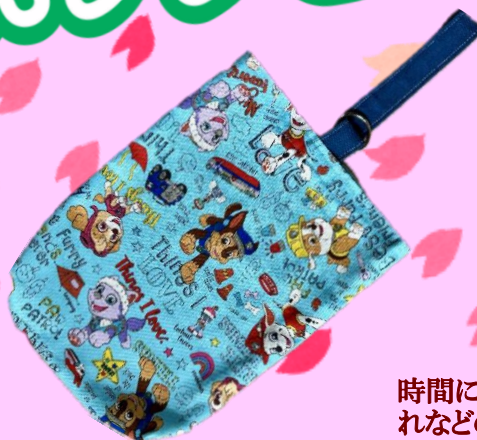
上履き入れ見本 (標準サイズ) 26 cm×17 cmマチ4 cm