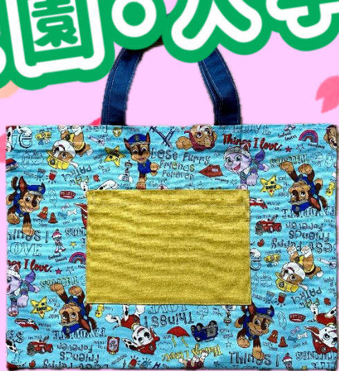
手さげバッグ見本(標準サイズ) 40 cm×30 cm