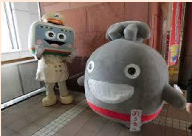
ハマの電ちゃんとのるるん