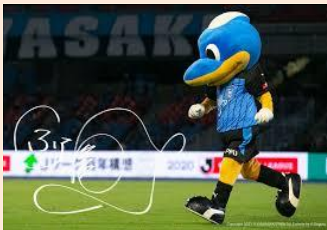
われらがふるん太