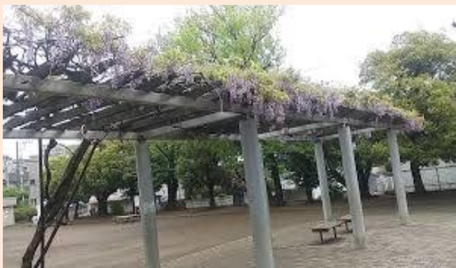
梶ヶ谷第1公園の藤棚