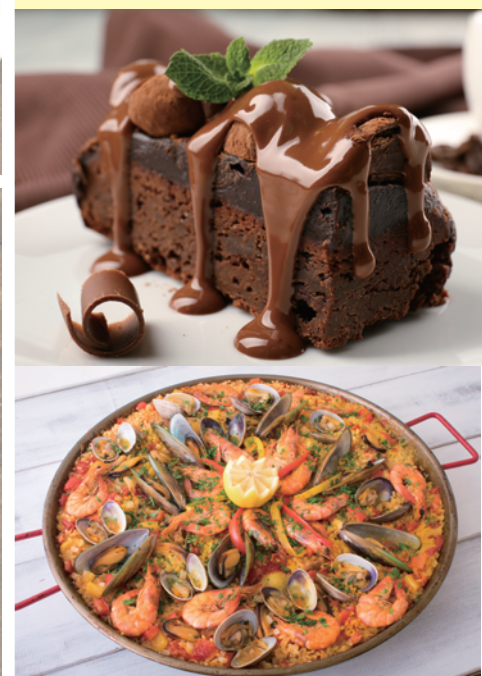
写真はイメージです。実際に作るものとは違います。

◆栄養士◆ ★「てくのかわさき」はじめ、企業の料理教室の講師を経て、現在は料理教室の仕事にかかわりながら、地域の食生活と健康作りの普及活動(栄養改善推進委員)にも従事しています。