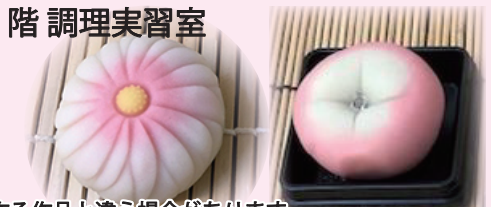
実際に作る作品と違う場合があります。